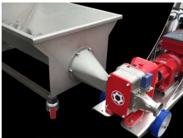
Tremonha para alimentar a bomba com uva